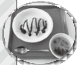
オムライス (週替わりランチ)