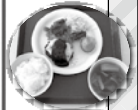
チーズハンバーグランチ (週替わりランチ)