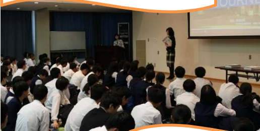
アイスブレイクと全体説明