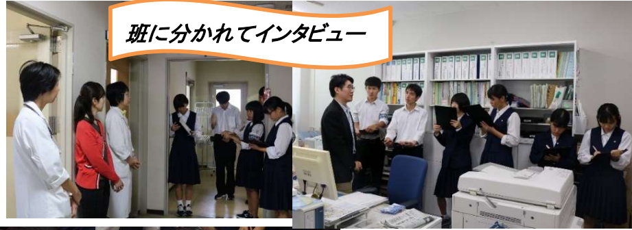
班に分かれてインタビュー